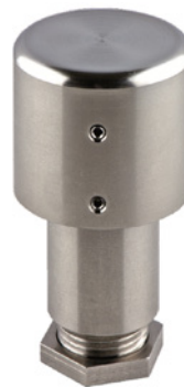
DFT 485 FTS 485 DTS 485