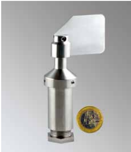
Windrichtungssensor WRS 485