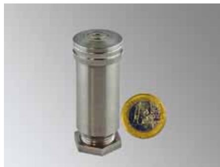
Bewölkungssensor WKS 485

zum Feststellen ob Bewölkung bei Tag und Nacht vorhanden ist oder nicht und zur Ermittlung der Wolkenuntergrenze