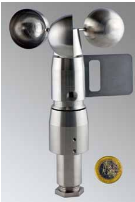
Wetterstation MWS 3

Die Miniatur-Mikroprozessor-Wetterstation MWS 3 misst die Parameter Umgebungstemperatur, relative