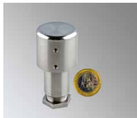
Kombisensor DFT 485

zur Messung der Umgebungstemperatur, der relativen Luftfeuchte,