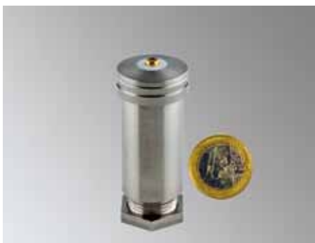
UV-Strahlungssensor UVS 485

zur Messung von Ultraviolettstrahlung als Globalstrahlung, 0–15000 mW, 210–380 nm