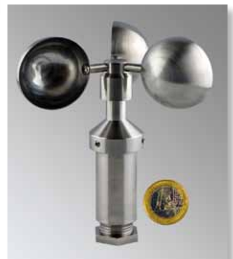
Windgeschwindigkeitssensor WGS 485

Konstruktion verhindern den gefürchteten Kapillareffekt (Ansaugen von Feuchtigkeit in das Innere des Anemometers).