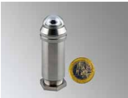
Globalstrahlungssensor GSS 485

misst die Globalstrahlung von 0–1.500 W/m 2 im Spektralbereich 305–2800 nm über Thermosäule.